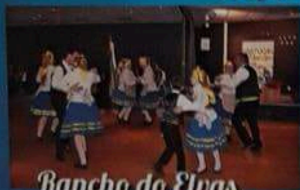
Rancho do Elvas