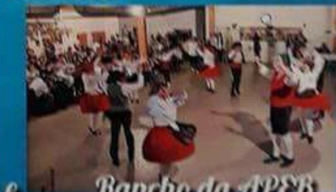
Rancho da APEB

Ingressos à venda a partir de 15 de Janeiro com: Ivo 0496 37 12 76 e Bruno 0477 52 79 82